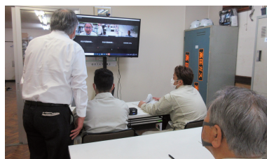
「鋼の熱処理」をテーマにしたリカレント講座の風景(綱テクノコートにて)

仕事に従事していると、「学ぶ」ことから遠ざかってしまいます。近畿大学の先生に講師を務めていただき、改めて知識を学び、また、最先端の知識を身に付けることで、企業の経営力の強化を図ります。