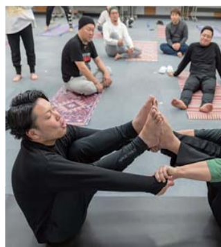
同じポーズもこうなります