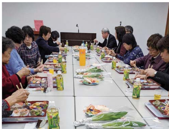
楽しいひとときを過ごすことができました

1月17日(水)、府中商工会議所にて、親睦委員会主導で、女性会新年親睦会を開催しました。