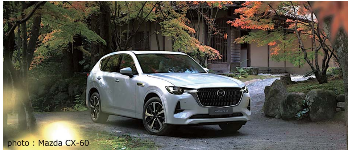
photo : Mazda CX-60