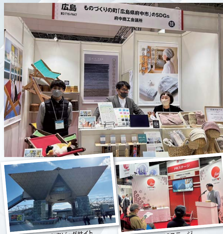
東京ビッグサイト

日本商工会議所が主催する共同展示商談会「FeINPON春2024」に、府中商工会議所会員企業3社が共同出展しました。同商談会は、地域資源や伝統の技を活かして作りあげた特産品、観光商品を集めた特設ブースです。また、他団体が主催するブースにも会員企業が出展し、新商品のPRや販路開拓に積極的に取り組みました。