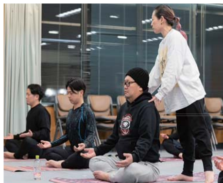
ヨガの基本を教えてくださいました