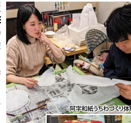
阿字和紙うちわづくり体験

この度のイベントで、阿字和紙、上下ガチャのPRはもとより、各種パンフレットの配布により府中市をPRすることができました。