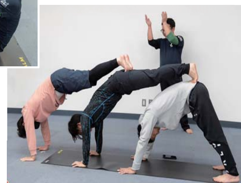
いろんなポーズをチーム戦で挑戦しました

て、呼吸法・ヨガベーシック・チャレンジポーズなどをチームに分かれて行いました。スポーツ例会後には新入会員歓迎会を『旬菜おくや』にて開催し、スポーツ例会のチャレンジポーズチーム対抗戦の結果発表と、表彰を行いました。