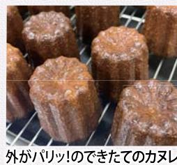
外がバリッ!のできたてのカヌレ

¥ パンセのカヌレ3種(ブレーン・せとか・シヨコラ) 各1個 378円 【専用ケース(3個入)1,490円】 問 41-2564