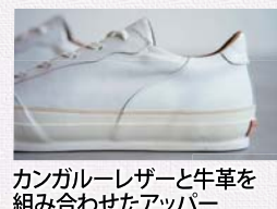
カンガルーレザーと牛革を組み合わせたアップパー

ヴィンテージスニーカーに影響を受けたクラシカルなデザインが特徴で、アップパーは、カンガルーレザーと牛革を組み合わせた「SPINGLE MOVE」を象徴する巻き上げソールと共通の波型を随所に採用している。かかとにヌメ革のヒールパッチ、つま先にトゥーガードを取り付け足元に重厚感を持たせた。高感度な大人をターゲットに、ビジネスからタウンまでどんなシーンでもスタイリング可能な、高級感漂うシンブルなデザインとなっている。