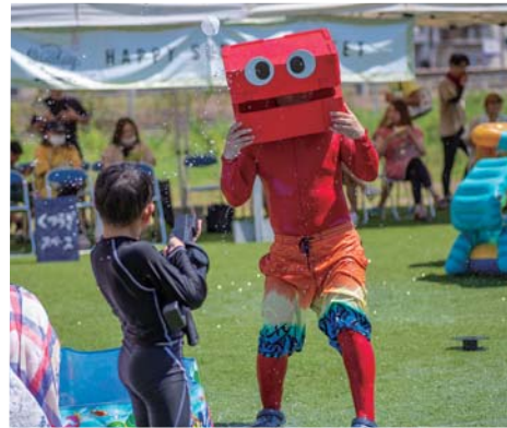
子どもと水遊びするヘギナビくん