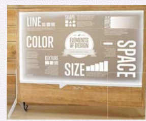
リニューアルされた透明液晶ディスプレイ「SURU」

¥ 「SURU」498,000円(税込) 31.5型 透明液晶ディスプレイ LED内蔵 カラー表示(黒・白以外)は、グレースケール16階調で表示 サイズ: W74×H61×D2.5cm (脚含む) W74.6×H61 ~ 69.5×D25cm 重量: 約8kg (脚含む) 材質: スチール 問 43-4886(大村)