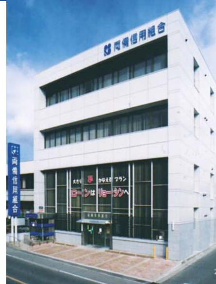
府中商工会議所エリア内の当組合店舗