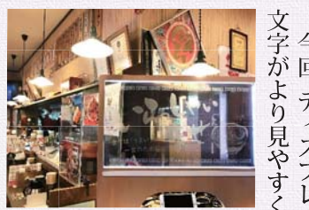
飲食店などで使われている「SURU」(旧デザイン)

今回、ディスプレイにLED照明を内蔵することで、映像や文字がより見やすくなり、視認性が向上した他、ボディがスリムになり、設置した時の安定感も増した。