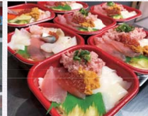
新鮮な海鮮丼が各種揃っている

¥ 海鮮丼(常時70種)各600円 ・シャリ大盛+100円/ネタ大盛+200円/特盛(シャリ+ネタ)+300円 ・お好みのネタの追加トッピング可 ・電話注文の方、お吸い物付 ・LINE公式アカウント会員募集(公式アカウントで午前9時までに注文すると50円OFF)